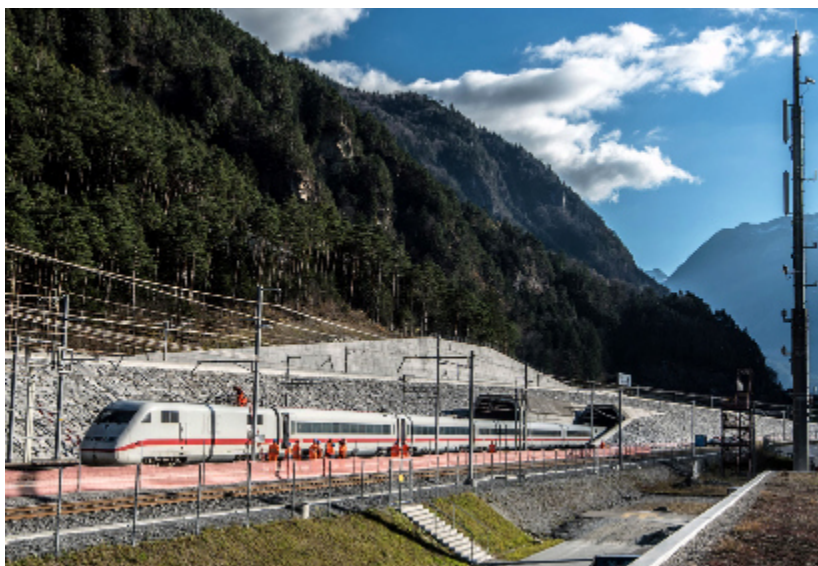
Alptransit rimescola le carte.