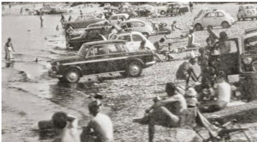
I campeggi di Tenero nel 1960