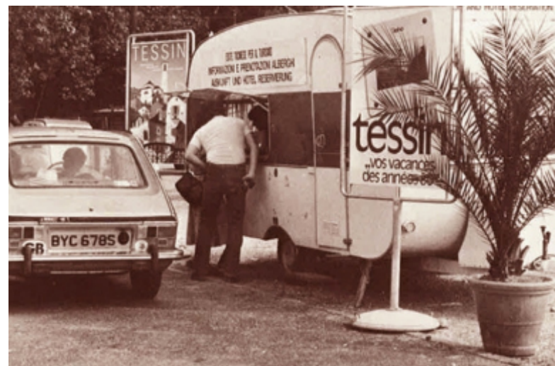
Promozione turistica a Gordola negli anni 60.